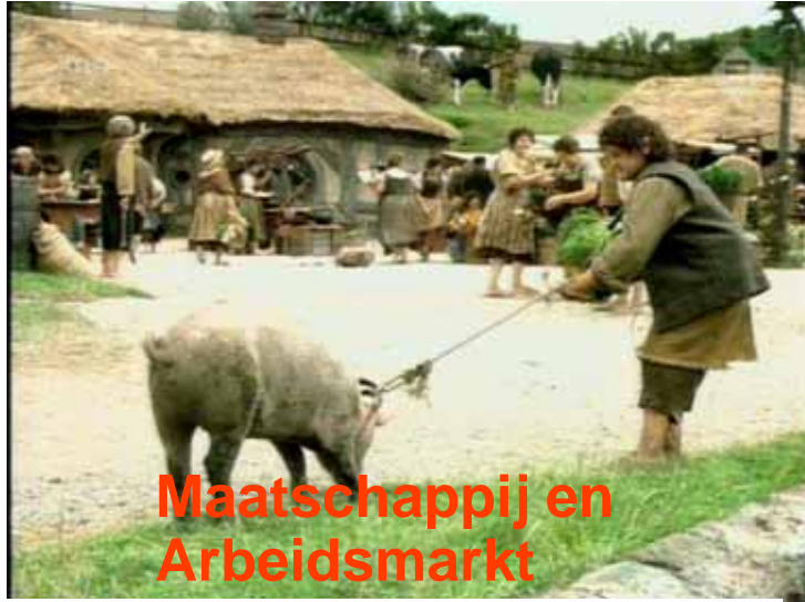
Maatschappij en Arbeidsmarkt