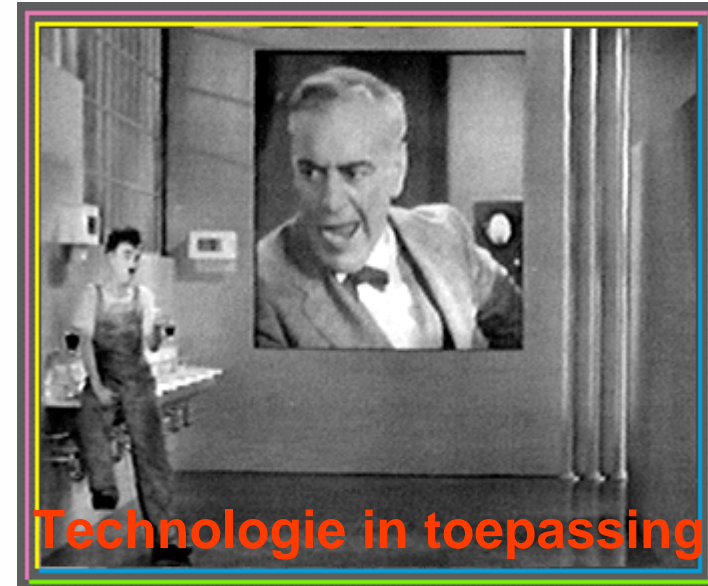
Technologie in toepassing